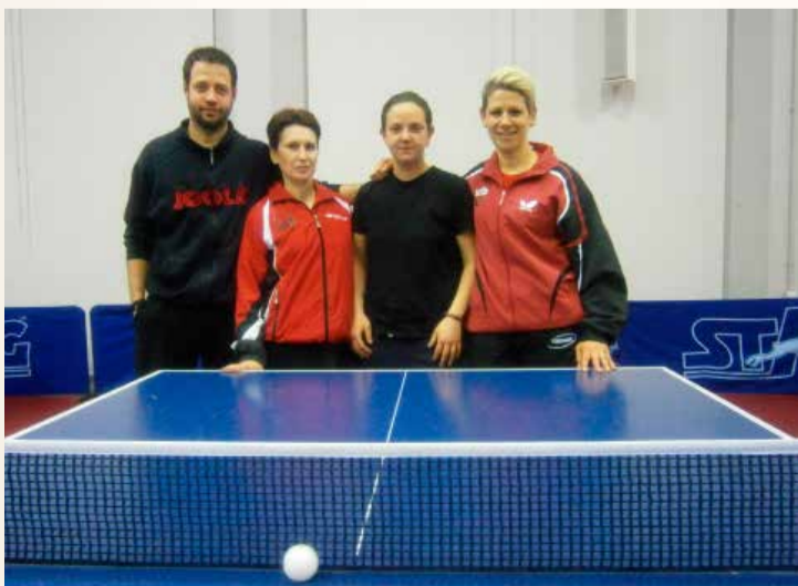
Οι προπονητές Πινγκ-Πονγκ