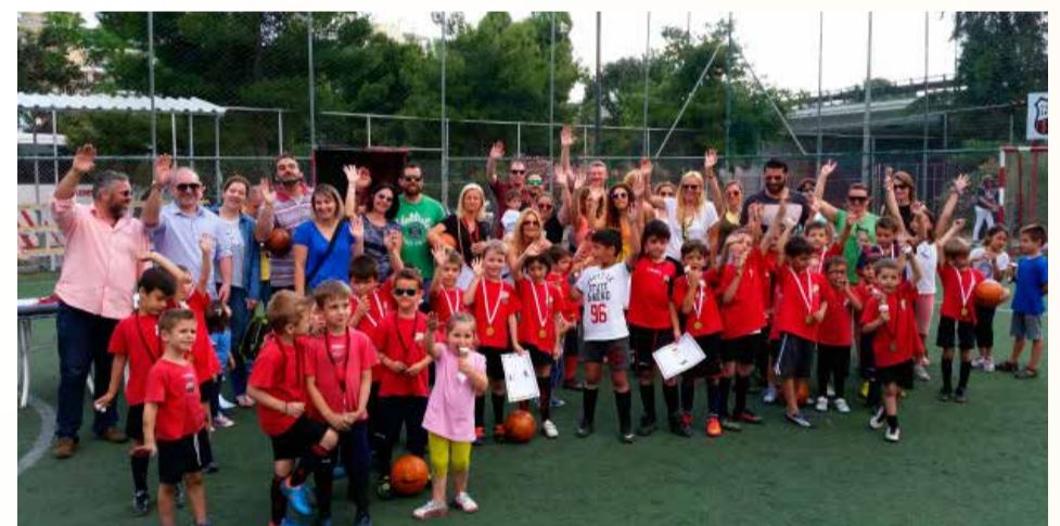
Ταταύλα Football Academy