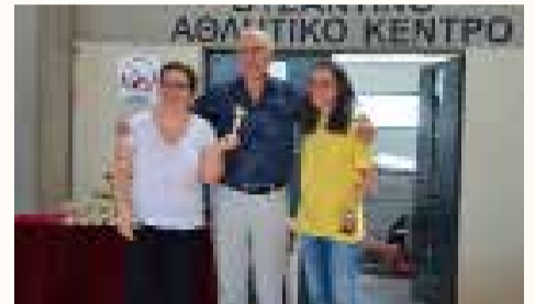
Ο διοργανωτής του Βυζαντινού Φεστιβάλ Μπριτζ με δύο βραβευθείσες κυρίες του Συλλόγου μας

δεν έχουν» ακόμη αρχίζει να παίζουν». Είναι το «χόμπυ κόλλημα», είναι ένα πανέξυπνο παιχνίδι με χαρτιά, αναγνωρισμένο από την Γενική Γραμματεία Αθλητισμού και την Διεθνή Ολυμπιακή Επιτροπή. ♣