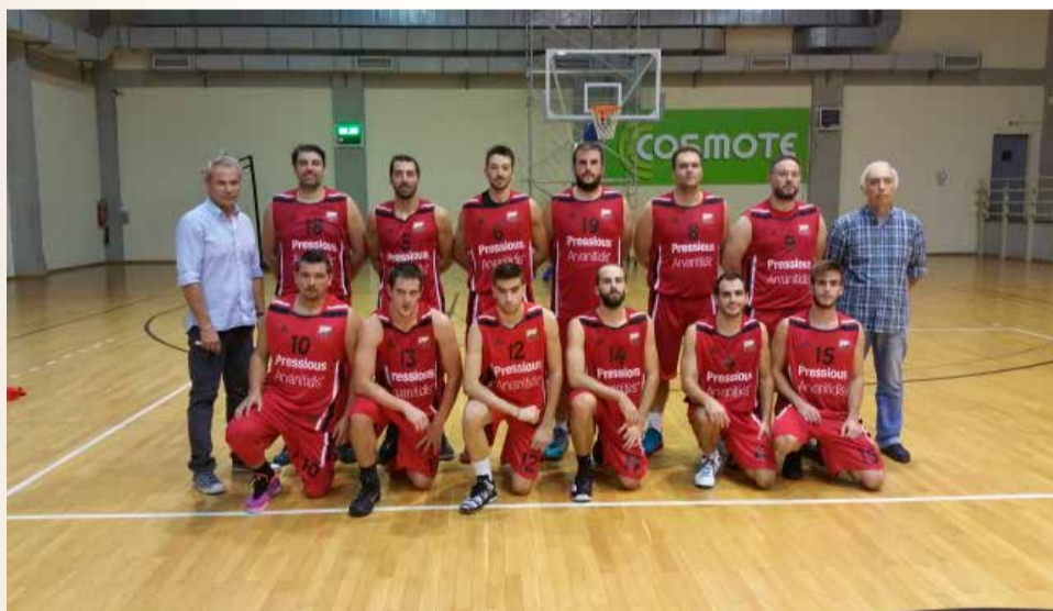
1η ομάδα ΑΝΔΡΩΝ