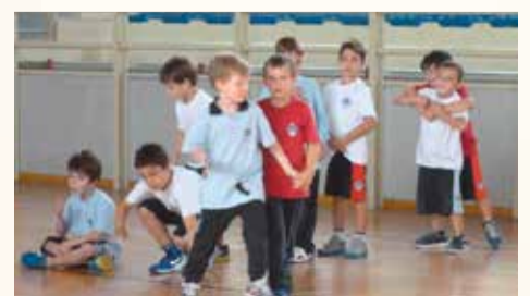
Οι Παμπαίδες σε προπόνηση