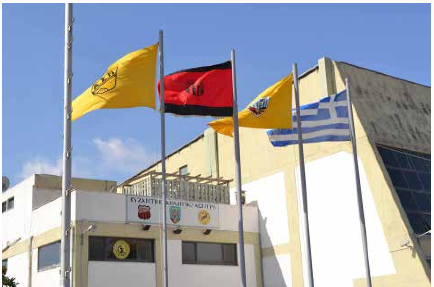
BYZANTINO ΑΘΛΗΤΙΚΟ ΚΕΝΤΡΟ (BAK)