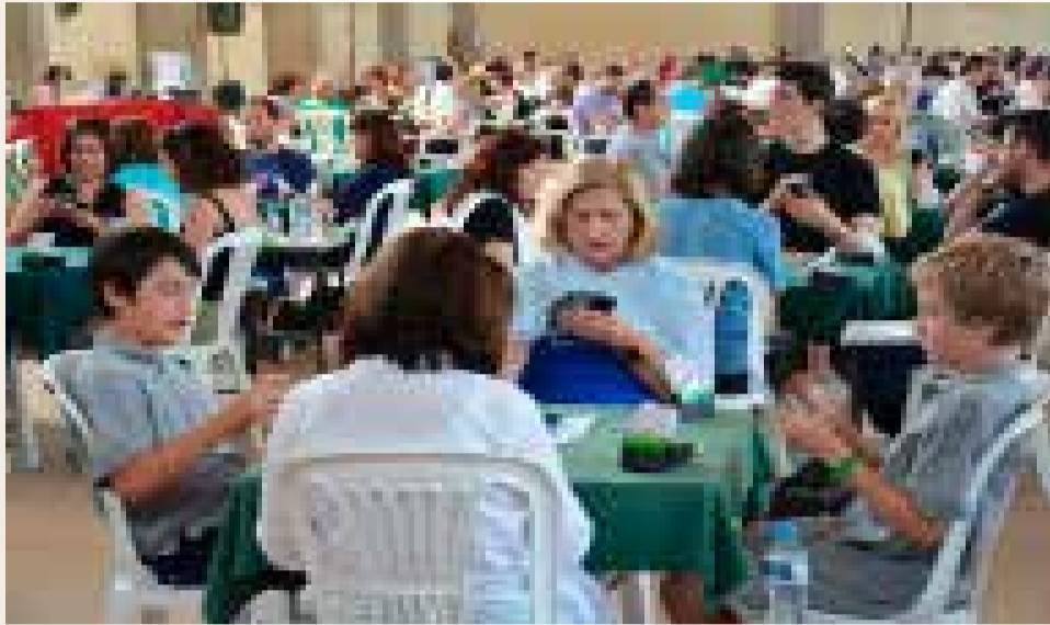
Αγώνες Βυζαντινού Φεστιβάλ Μπριτζ

Είχαμε ακούσει σε μια παρέα για ένα πνευματικό αθλημα που ανθίζει στην πόλη μας το Π.Φάληρο. Πολύ-πολύ παλιό ως προς την επινόηση, ιστορία και εξέλιξη του αλλά και μοντέρνο όσο αφορά την διαδοσή του και την ενασχόληση όλο και περισσότερων με αυτό.